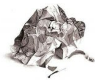
تاریخچه اشتغال‌های آرایه‌ها در باب خشونت علیه زنان